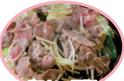
ジンギスカン+野菜セット