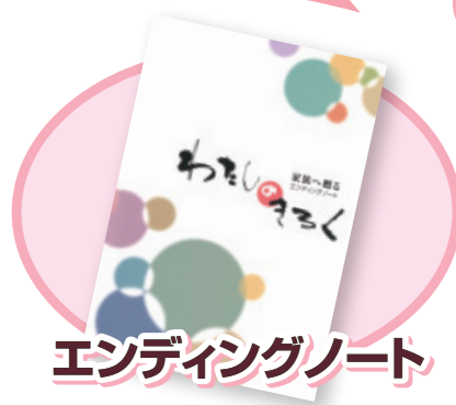
エンディングノート