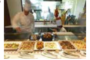
(写真はバイキングイメージとなります。)

1 JR札幌駅北口(8:10集合)=太平斎場(8:40集合)=高速=千歳 岩塚製菓(工場見学とお土産付)⑩=しこつ湖鶴雅リゾートスパ水の譚(ランチバイキング)⑦⑩=サッポロビール恵庭工場(工場見学・試飲)⑩=恵庭道の駅⑩=太平斎場(17:30頃)=JR札幌駅北口