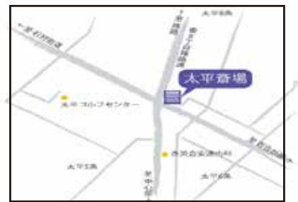
太平斎場 北区太平7条5丁目2-1

お申込みのご案内 詳しい旅行条件と個人情報のお取扱いを説明した「旅行条件書」をお渡しいたしますので、事前にご確認の上お申込みください。