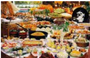
(写真はバイキングイメージとなります。)

1 JR札幌駅北口(8:00集合)=太平斎場(8:30集合)=高速=新富良野プリンスホテル ランチバイキング⑦⑩=ニングルテラス⑩ =ファーム富田(ラベンダー鑑賞)⑩=フラノマルシェ(お買物)⑩=高速=太平斎場(18:30頃)=JR札幌駅北口