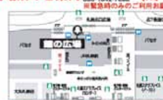
JR札幌駅北口団体待合室の広場

集合場所のご案内 当日の富良野観光(7時~対応) 050-1642-7688 ※開業時のみのご利用をお願いします。